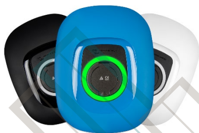
Черен, син (стандартен) или бял лицев панел