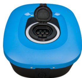
EV Charging Station NS конектор за зареждане