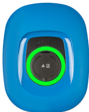
EV Charging Station NS